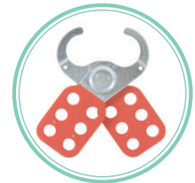
APERTURA DE QUIJADAS DE 1" (25mm)